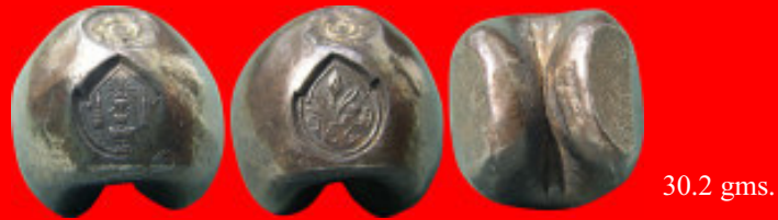
ตรามงกุฎ / จักร ช่อรำเพย - Mongkut / Chak Cho Rum Pire